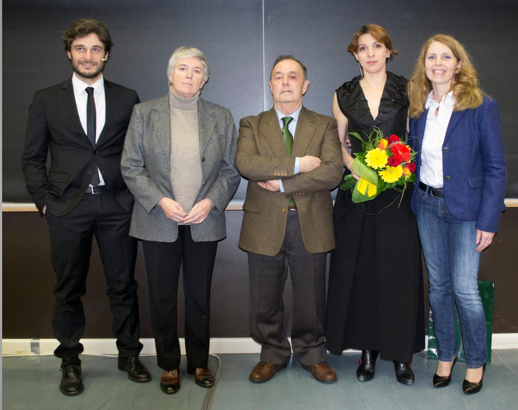
Dipartimento di Scienze Chimiche e Farmaceutiche