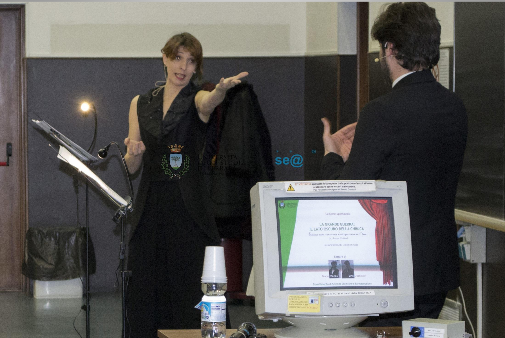
Dipartimento di Scienze Chimiche e Farmaceutiche